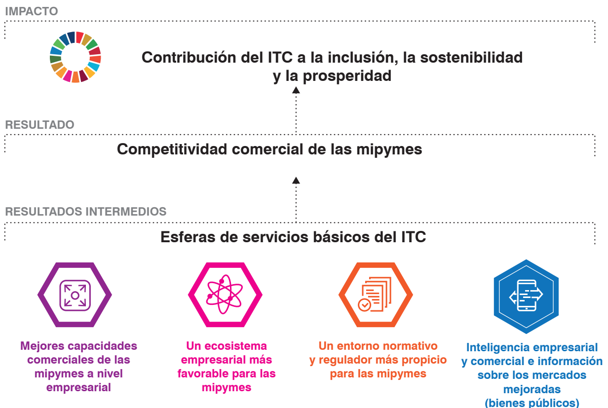
FIGURA 4. Versión simplificada del marco de resultados del ITC

Nota: En el anexo, está disponible una versión íntegra del marco de resultados con los indicadores institucionales.