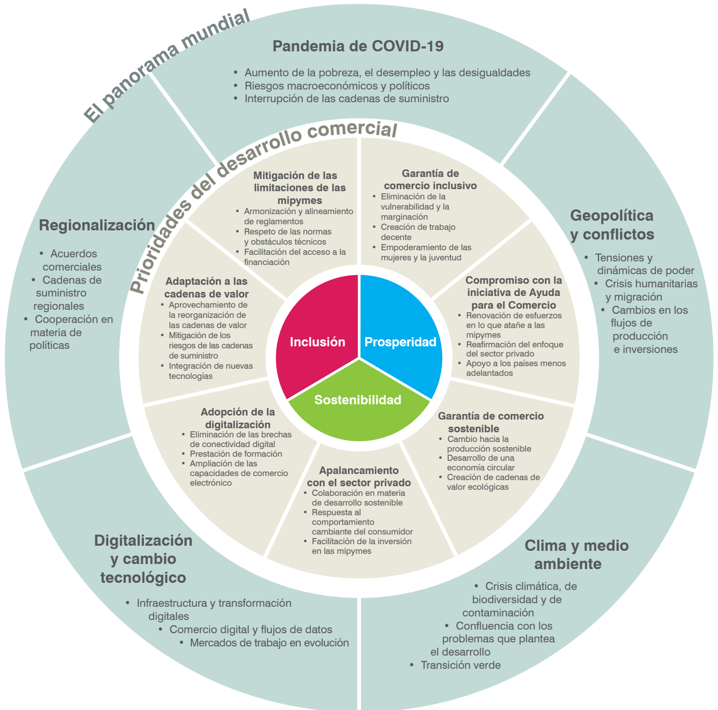
FIGURA 2. Contexto estratégico del ITC