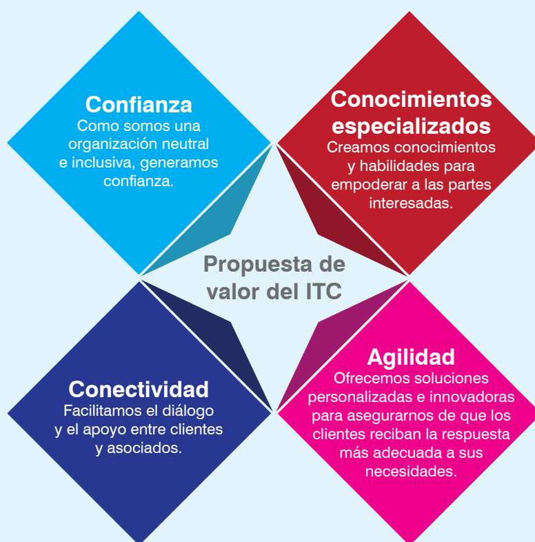
FIGURA 3. Propuesta de valor del ITC

El mandato del ITC combina un enfoque centrado en la expansión de las oportunidades comerciales para las mipymes con el objetivo de lograr el desarrollo sostenible. Nuestra propuesta de valor reúne un conjunto único de capacidades técnicas y operacionales para dar respuesta a las necesidades del cliente.