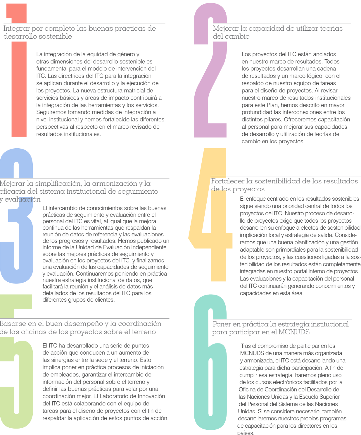
FIGURA 7. Recomendaciones para mejorar el desempeño y las respuestas del ITC en el presente Plan Estratégico