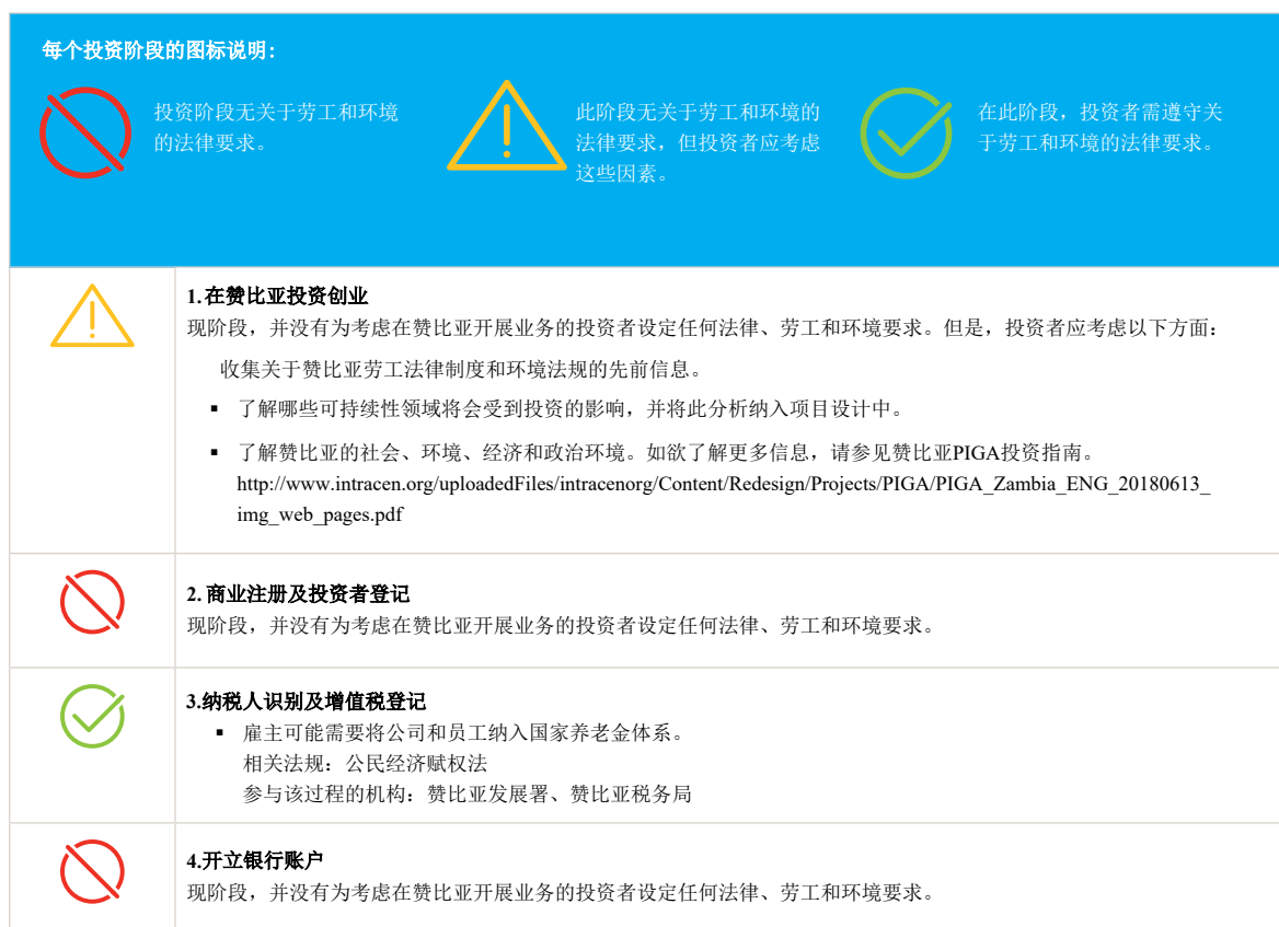
图3 清单：赞比亚对投资者的环境和劳工要求

图3提供了赞比亚农业加工和轻工制造领域的潜在投资者需要考虑的环境和劳工要求清单。清单所列的不同步骤是指投资者为取得投资证书及开始经营业务所需办理的不同类别的程序。