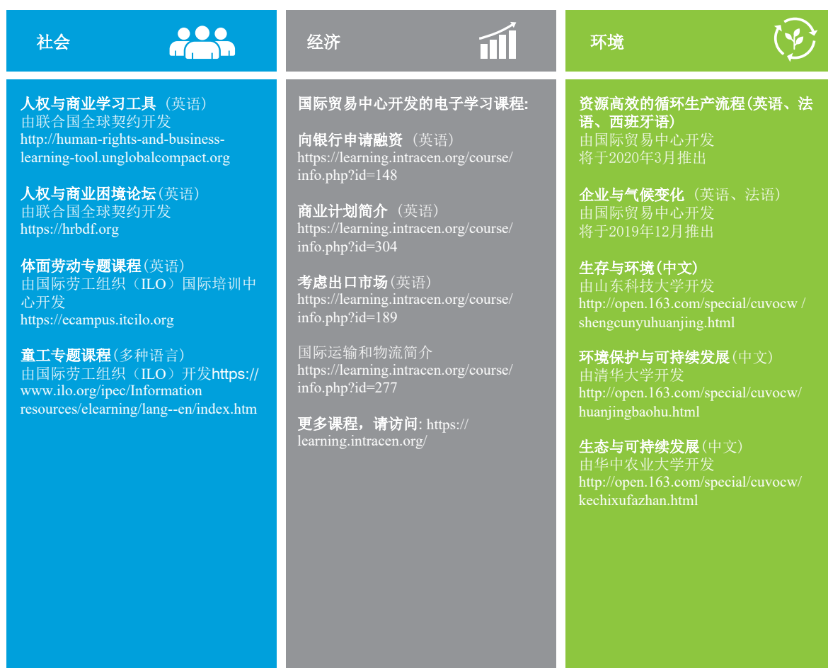
图5. 按可持续性范畴划分的免费电子学习课程