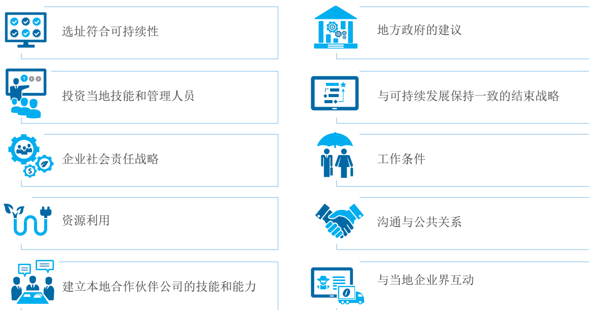
图4 可持续商业行为的补充措施

本章介绍了一些公司可以纳入其在赞比亚的业务活动中的措施，以帮助公司落实可持续经营方法（汇总于图4）。本章最后还重点介绍了相关的中国和国际自愿性标准。